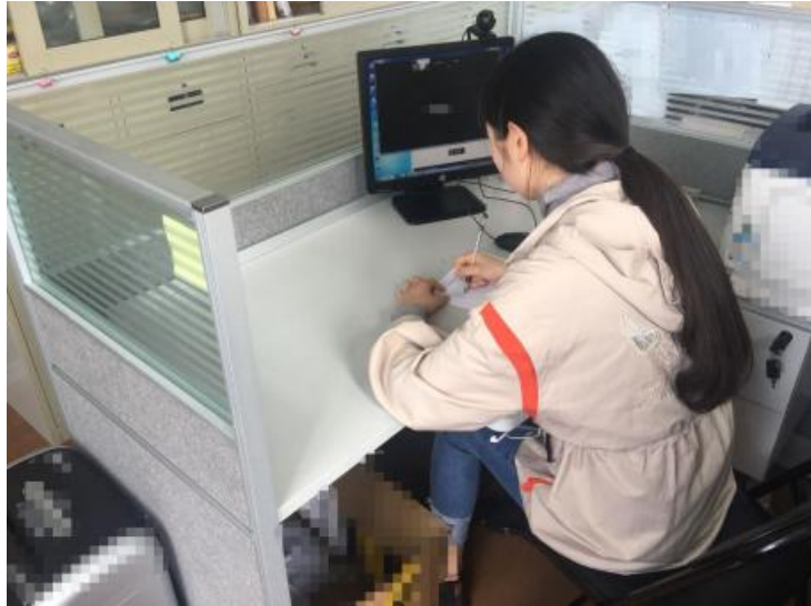
辅机位镜头效果图

2. 辅机位：从学生侧后方成 45° 拍摄，要保证学生主机位屏幕及桌面等周边环境在画面中清晰可见。保持平台静音，关闭设备中可能影响互动交流的通话、声音、震动、闹钟等软件及功能。