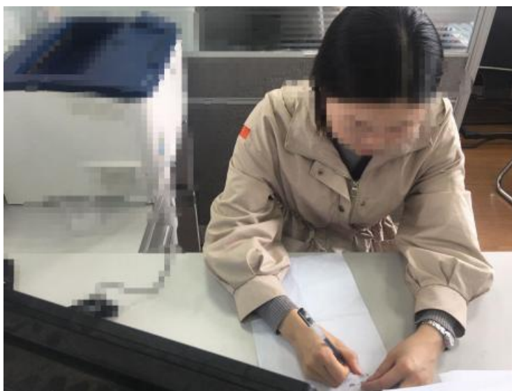
主机位镜头效果图

1. 主机位：设于学生正面，学生面部、上半身及双手在画面中清晰可见，不得佩戴帽子、墨镜、口罩等，不得遮挡面部、耳朵等部位，全程开启平台声音和视频，关闭其他可能影响互动交流的软件及屏保等功能，面试过程中学生不得擅自离场。